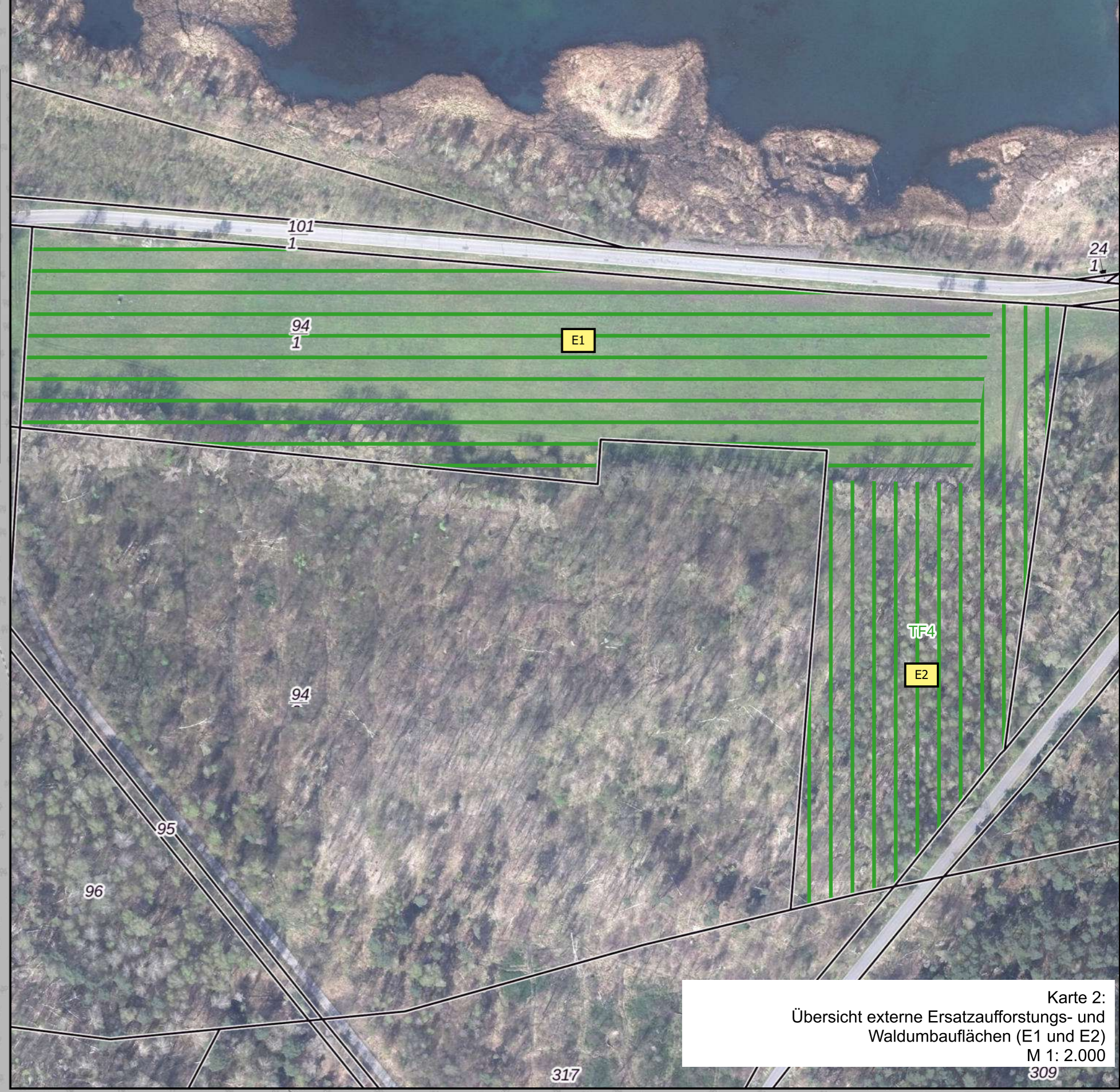
Karte 2: Übersicht externe Ersatzaufforstungs- und Waldumbaufächen (E1 und E2) M 1: 2.000